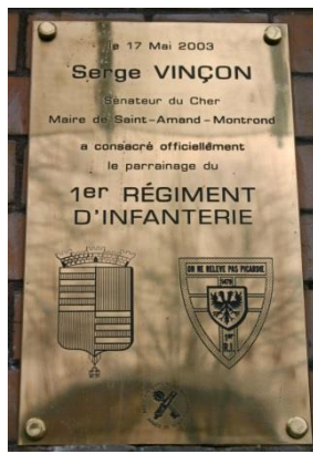
Plaque sur le P.C. quartier Rabier à SARREBOURG

Lors des adieux aux armes du Général de la Chesnais, les représentants des trois amicales étaient présents.